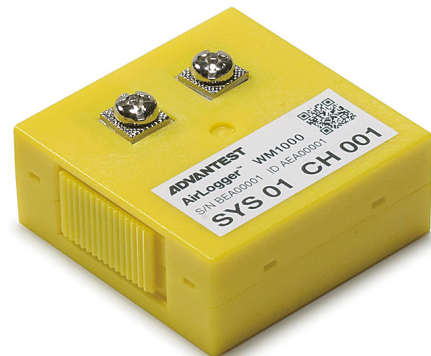
温度測定ユニット(実物大)