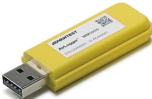
PC通信ユニット(実物大)