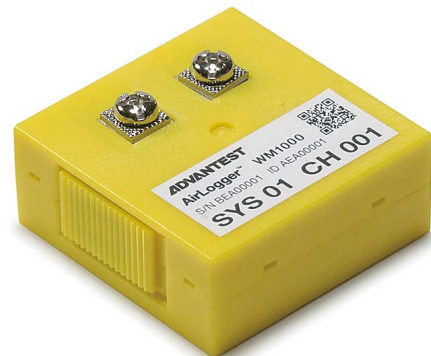
温度測定ユニット(実物大)