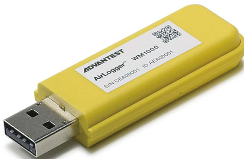
PC通信ユニット(実物大)