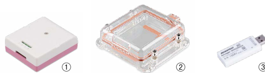
① ひずみ測定ユニット